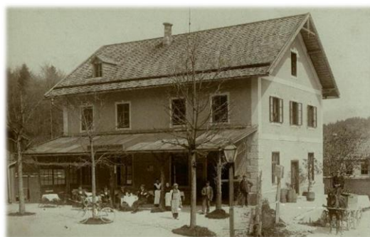
Bahnhofsrestaurant anno 1886